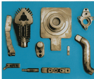
銅の精密鍛造品 Precision copper forgings