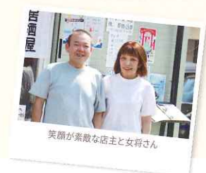
笑顔が素敵な店主と女将さん

【住 所】神奈川県相模原市緑区西橋本 2-26-14 森崎店舗 A 【TEL】042-773-3291 【営業時間】ランチ 11:30~14:00(L.O.13:30) ディナー 17:00~23:00 【定休日】毎週日曜日、第一・第三月曜日