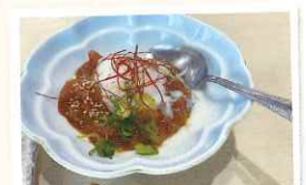
昼も夜も人気の海鮮味噌ユッケ

オリジナルの酎ハイもそろい、手作り料理と魚介の旨みをしっかり味わえる一軒だ。ごちそうさまでした。(大谷)