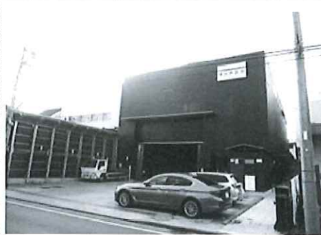
新事務所・倉庫の外観

属工業で在庫置き場を一部間借りしていたが、その分も全て新倉庫に移した。今後、最適な在庫の保管方法を模索し、縦置き用のトラックを増やすことなどを考える。