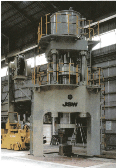
1,000トンプレス 1,000-ton forging press

銅リング 最大径 1,500mm Copper rings Maximum diameter: 1,500 mm